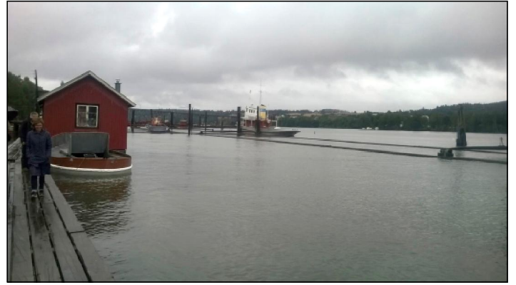
Fetsundin uittomuseoaluetta Glommajoen varrella.

missä viimeisiä tukkeja uitettiin vuonna 1985. Venemuseossa saimme ihailia paikallisia uittoveneitä ja Nordre Øyeren luontokeskuksessa saimme tietoa jokialueen eläimistöstä ja kasvillisuudesta. Sateisen päivän päätteeksi ilma seestyi aurinkoiseksi ja pääsimme nauttimaan Glommajoen monipuolisista rantamaisemista lintuineen jokilaivoilla Mørkfos ja Vildanden. Auringonlaskussa matkamme jatkui Elverumiin.