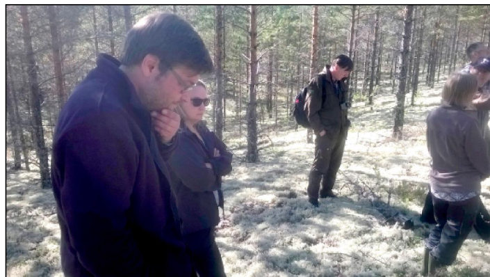
Vuoden 1978 metsäpaloalueella.

Ensikertalaisena kävijänä pohjoismainen metsähistorian konferenssi oli antoisa ja tunnelma varsin