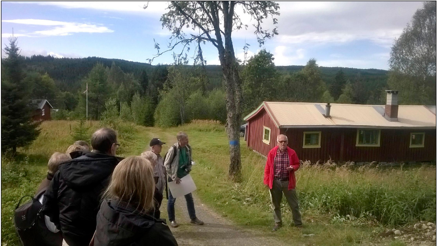
Hvarstadin tilalla keskustelua metsämaiseman muuttumisesta ja karjamajojen nykykäytöstä.

tuttua. Nykyisin monet karjamajapihat on entisoity kesämökeiksi omaan ja vuokratkäyttöön. Merkillepantavaa oli, että alueilla ei ollut sähköliittymiä, mutta aurinkopaneelit katoilla ja tonteilla toimivat energian tuottajina.