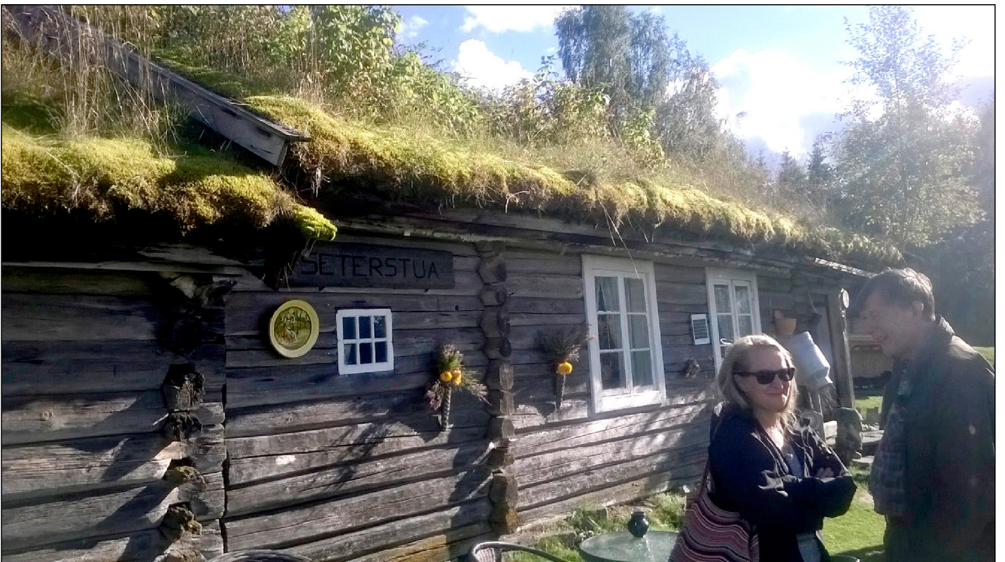
Orre Seter - maaseutumatkailun mahdollisuus.

Perehdyimme maisemiin laidunnetuilla rinteillä, joille karja oli aikoinaan kesäkaudeksi siirretty. Ns. karjamajojen (seter) ympärille oli rakennettu myös tarpeelliset piharakennukset kesäaikaista elämistä ja askareita, mm. juustontekoa, varten. Usein perheiden nuoret tytöt ja pienemmät lapset huolehtivat paimentamisesta ja lypsämisestä majojen ympäristössä. Karjamaja- ja laidunkulttuuri on ollut yleistä vuoristoseuduilla Norjassa ja Ruotsissa Taalaimaalla, sekä Keski-Euroopan alppialueilla. Suomessa Pohjois-Pohjanmaallakin toiminta on