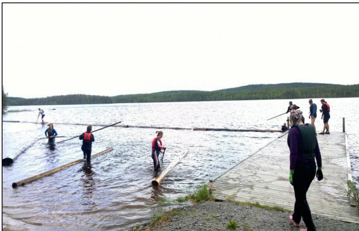
Eerikkilän eräoppaat tukkilaistaitojen peruskurssilla.

Koskea tultiin alas tukilla Ruunaan Siikakoskella tukkilaisten toimesta näytösluonteisesti. Närelenkin vääntö esitettiin myös näytösluonteisesti työn turvallisuuden takia. Metsätyöperinteen osalta oppiaineina olivat puun kaato justeerilla ja pokasahalla, puun karsinta kirveellä, puun apteeraus ja katkominen, kuorinta ja puiden taapeliin laittaminen.