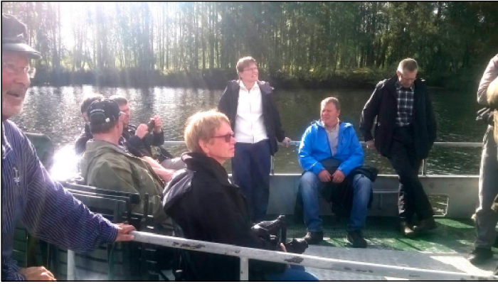
Jokilaivalla Glomma-joella lintu- ja kasviyhdyksuntia ihailen.