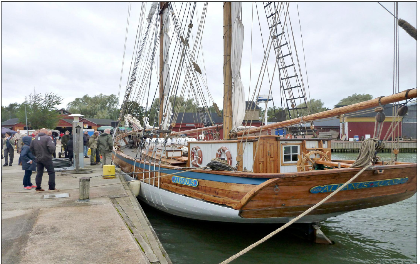
Retkeläiset tutustuvat purjealus Albaukseen.

Vuonna 1988 valmistunut Albanus lähestyy kuitenkin jo viimeistä satamaansa. Seuraajan, kaljaasi Emelian kuusivuotiset rakennustalkoot ovat aluillaan. Alus lasketaan vesille itsehallinnon 100-vuotisjuhlien aikaan vuonna 2021. Postivenet kisaavat joka kesä Eckeröstä Ruotsin Grisslehamniin. Postiveneturmissa menehtyneiden muistokivi puhuu rannalla isää, miestä odottaneiden ahdistuksesta.