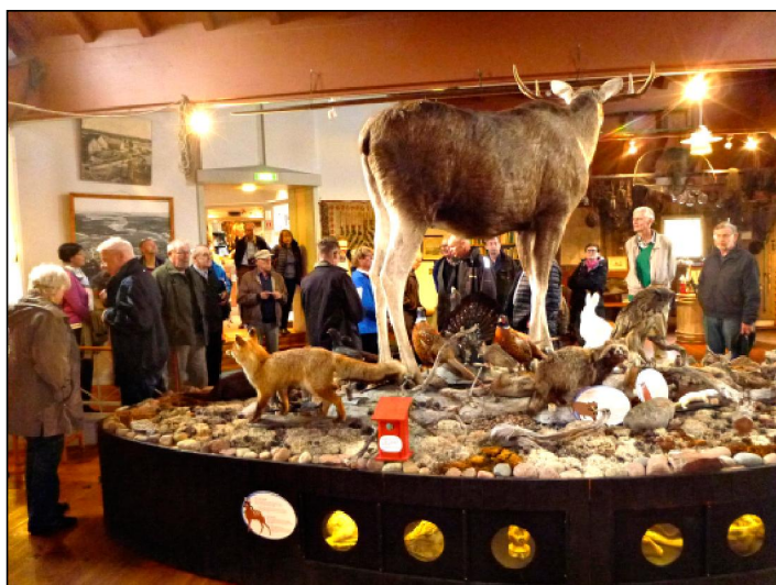
Metsästys- ja kalastusmuseossa oli paljon nähtävää.

Museon monipuolinen ja runsas asekoelma ihasutti. Kaikki esineet ovat lahjoituksia. Vanhimmat kolhon näköiset aseet nostivat mieleen kunnioituksen hylkeenpyytäjien ampumataitoa kohtaan. Kalastus ja metsästys ovat edelleen merkittävä osa alueen matkailua. Wirta kertoi myös, kuinka erääseen taloon tuli miniä Grönlannista. Hänen elikoiden hyödynnyksen periaatteensa oli: ”siasta jää saparo, hylkeestä ei mitään”. Hyljeherkkua hän valmisti kuitenkin vain kerran.