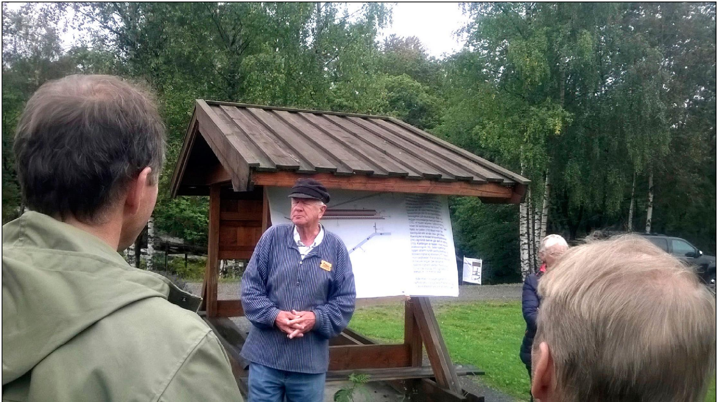
Sagdalenissa 1700-luvun vesikäyttöisen raamisahan toiminnan esittely.