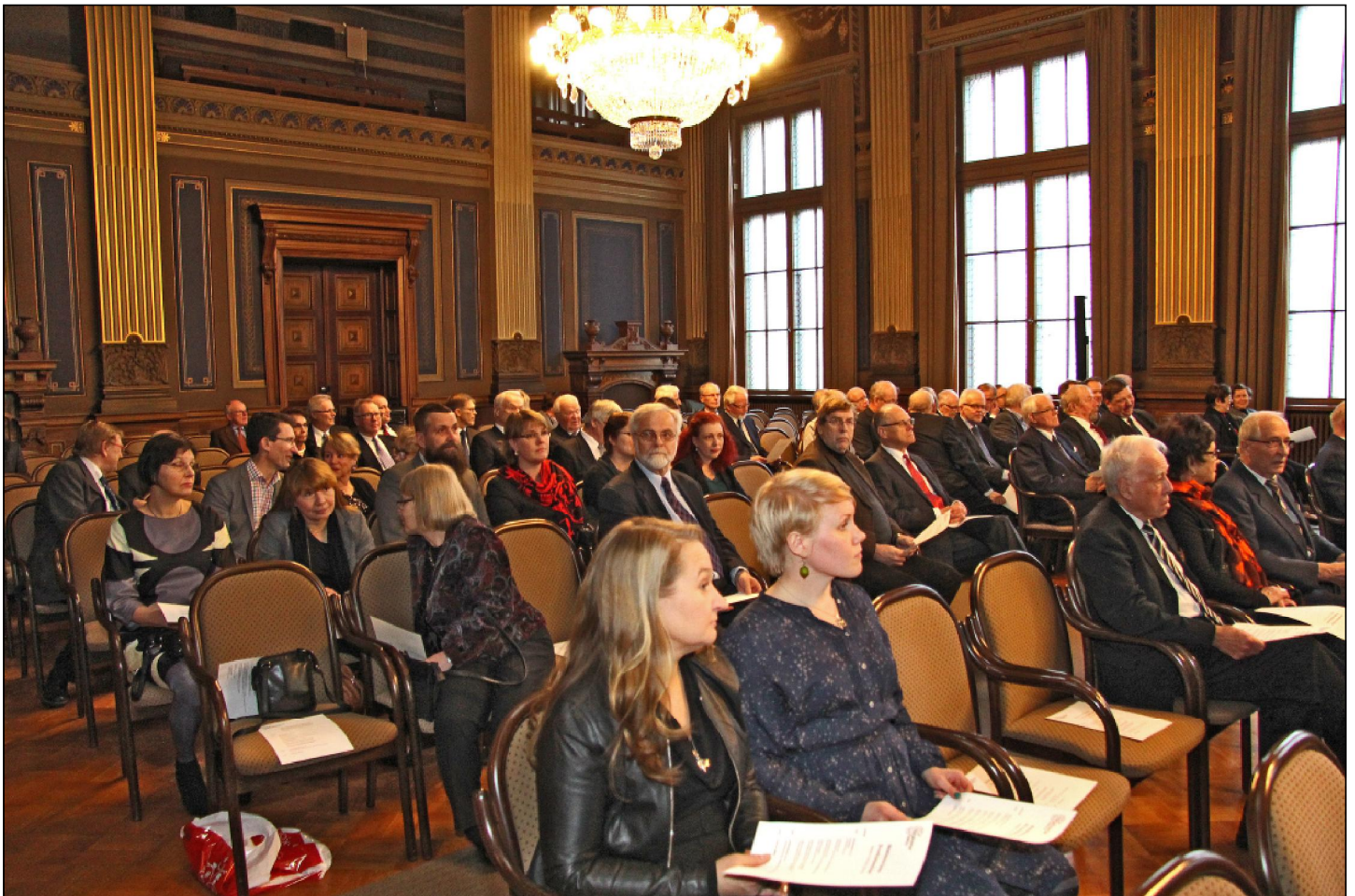
Juhlaseminaariin osallistui lähes 100 henkilöä.

Puheenjohtaja Tapani Tasanen kiitti seuraa 20 vuoden aikana tukeneita tahoja sekä erityisesti juhlaseminaarin mahdollistaneita tukijatahoja