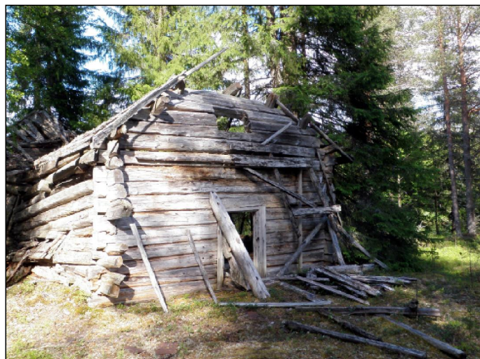
Kämpän jäännös Pudasjärven Saarikoskella.

Tarjoilujen järjestämiseksi vuosikokoukseen, esitelmätilaisuuteen sekä jäsen- ja tutkijatapaamiseen pyydetään ilmoittautumaan 15.3.2015 mennessä majak.kovanen@gmail.com .