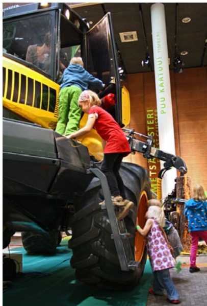
Näyttelystä löytyy myös metsäkone.

Omatoimisen näyttelyvierailun lisäksi Pilke tarjoaa ryhmille erilaisia työpajoja ja opastuksia. Oppimisfilosofiassa painotetaan tutkivaa ja toiminnallista oppimista sekä luonnonvarojen kestäväen käytön merkitystä ongelmien ratkaisussa. Oman tekemisen aktivoimisella halutaan luoda uskoa oman toiminnan mahdollisuuksiin; itse tekemällä voi vaikuttaa.