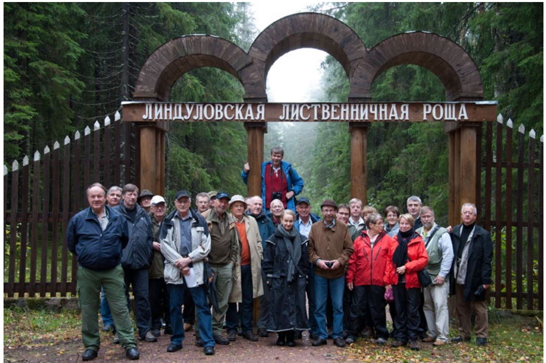
Ryhmäkuva Lintulan lehtikuusikon portilla.

Raivolan (nyk. Roštšinin) keskustan vanhalla kirkkomaalla poikettiin katsomassa raivolalaisen Pohjoismaissa laajasti tunnetun runoilijan Edith Södergranin muistomerkkiä. Päivän lounas syötiin Terijoella modernissa ”Yacht Club” -rantaravintolassa ja lahden yli tiirailtiin Kronstadtin silhuettia.