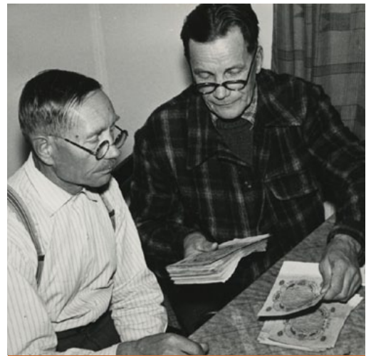
Kuva: Metsäkauppa Ruokolahdella 1956.

Kansanrunousarkiston yleiset keruuohjeet: http://www.finlit.fi/kra/keruuohjeet.htm