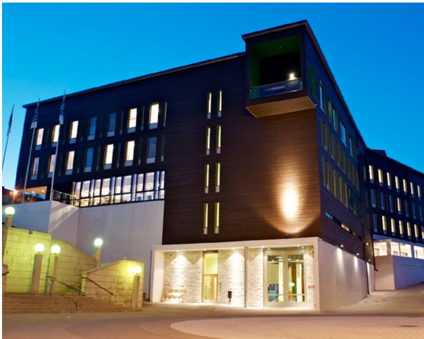
Pilke-talon.