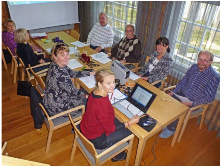
Metsähistorian Seuran hallitusta kehittämisseminaarissa Kerkässä Suomusjärvellä lokakuussa 2011.