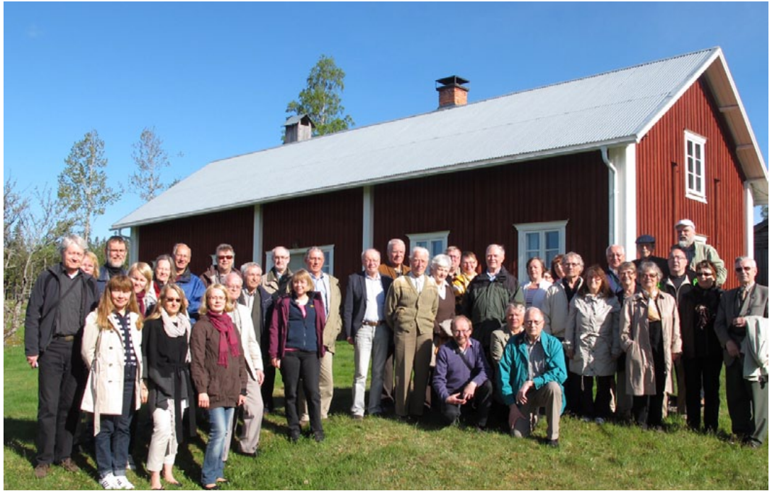
Yllä: Matkalaiset Juhoilan savupirtin pihapiirissä. Viereisellä sivulla: Juhoilan vanhoja kaskimaisemia.

Keskiviikkoaamuna, ennen paluumatkalle lähtöä, kävimme Juhoilan perinnetilalla ja Mattilan tilan savupirtissä. Juhoilan tila on nykyään yksityisomistuksessa, joten savupirttiin tai muihin rakennuksiin emme päässeet. Mutta ihailtavaa riitti ulkona pihapiirissäkin ja ammoisten aikojen kaskiviljelystä kertovat maisemat olivat kauniit. Metsäsuomalaiset tunnetaan myös nimellä kaskisuomalaiset, mikä kertoo metsäsuomalaisten tavasta elää Ruotsin erämaissa ensimmäisen sadan vuoden aikana. Kaski poltettiin yleensä keväällä, ja alkukesästä kylvettiin kaskiruis. Mikäli uudisasukkailla oli karjaa, annettiin sen syödä ensimmäinen sato, sillä sen jälkeen ruis haaroit entistä enemmän. Vasta toisena kesänä kaskan polton jälkeen kerättiin sato ihmisille. Kaskiviljely kiellettiin Ruotsissa kuitenkin jo 1640-luvulla kaivosteollisuuden lisääntymisen ja metsien arvon kohoamisen vuoksi.