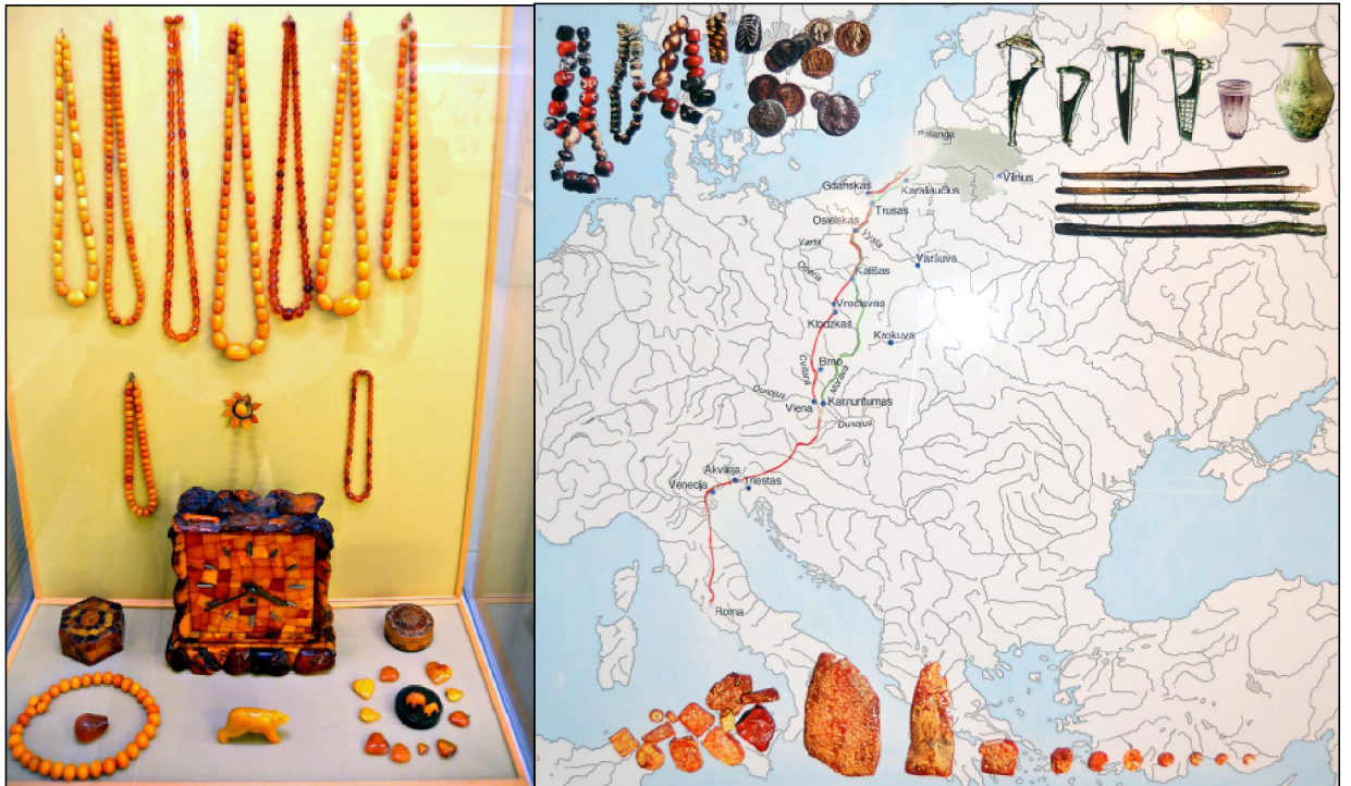
Meripihkan käyttötapoja sekä meripihkan matka Euroopan hoveihin.

Liettuan rannikolla Palangan lomakaupungissa ryhmämme oli määrä olla iltapäivällä. Meitä odotettiin hotellissamme, joka itse asiassa on metsäammattilaisten oma lomahotelli keskustan liepeillä. Neuvostoajan perintönä valtion metsäammattilaisilla on lisäksi virkistytymiskeskus hotelleineen Palangan Kretingassa aivan meren rannalla.