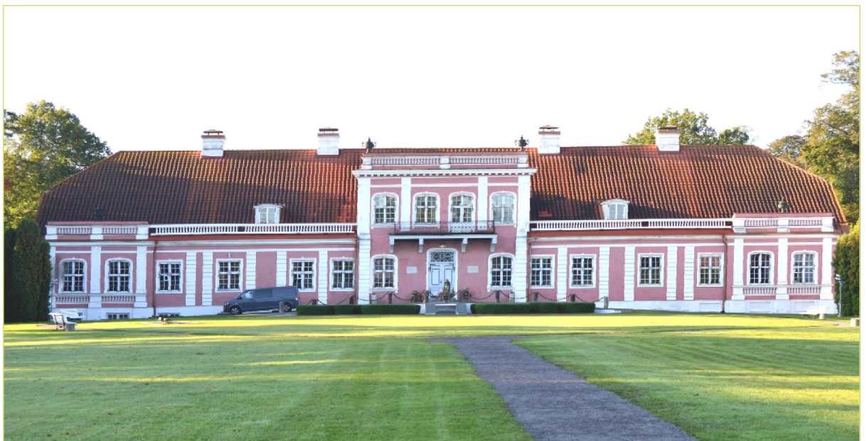
Sagadin kartanon päärakennus.