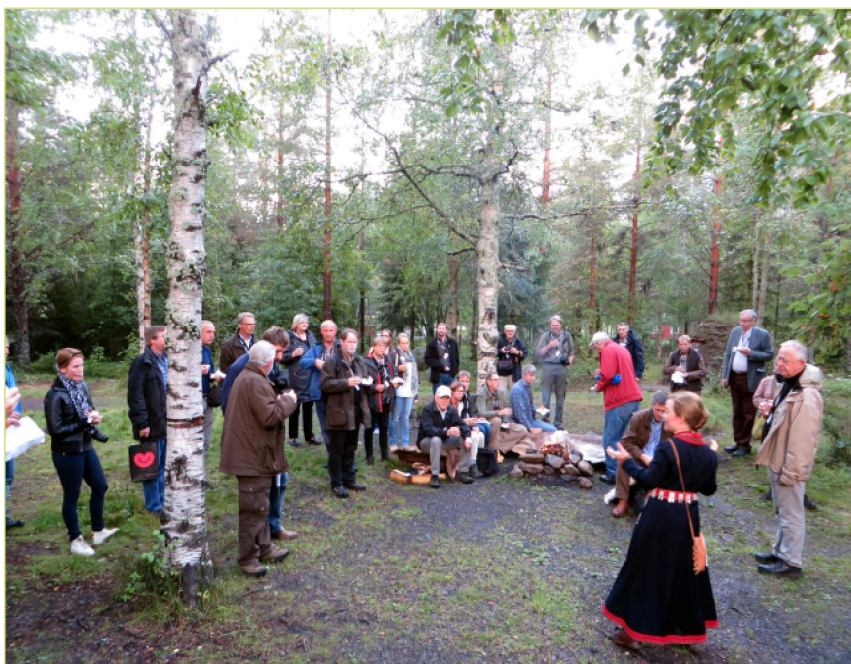
Uumajassa vierailtiin saamelaisten vanhoilla asuinpaikoilla.

Perillä Lyckselessä tutustuttiin uuteen saamelaiskokoelmaan ja -näyttelyyn Skogsmuseetilla. Ekskursiopäivänä matkattiin Vindelälvenin yläpuolelle ja vierailtiin useilla kohteilla, mm. Jovans Ekoparkissa ja Paulidenissa, joissa metsien käytön merkkejä voi nähdä eri aikakausilta. Oli mielenkiintoista kuulla esimerkiksi, että saamelaiset käyttivät pettua yleisesti ravintonaan aina 1850-luvulle asti, jolloin sen käyttö metsänhoidollisin perustein kiellettiin. Saamelaisten