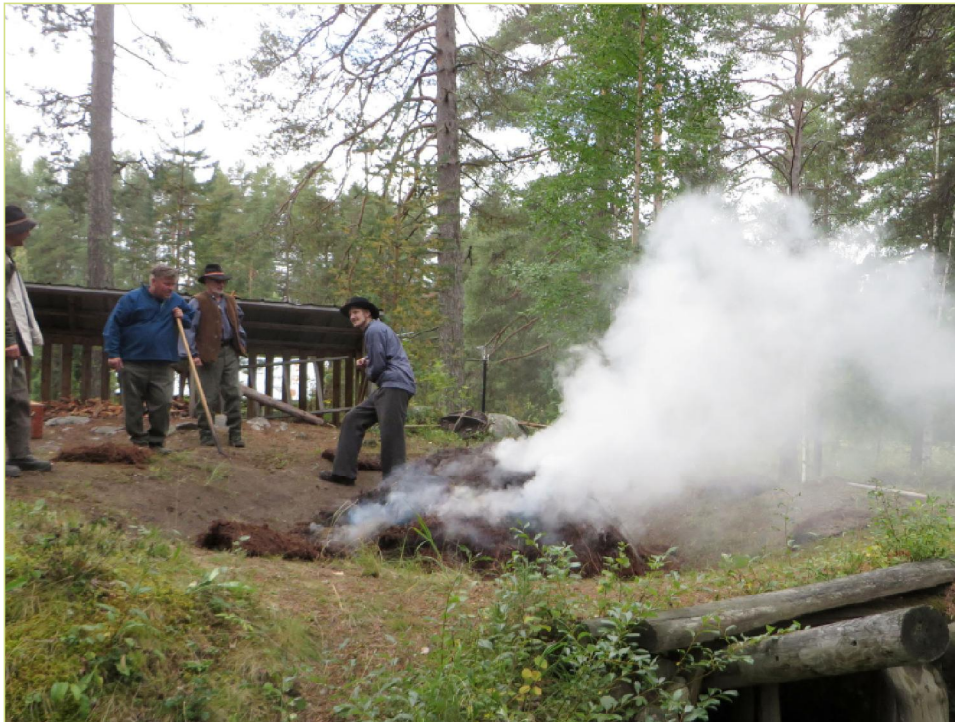
Tervanpolttoa Skogens dag -päivänä.