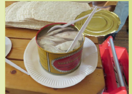
Konferenssin aikana päästiin myös maistamaan ruotsalaisten herkkua, sutrströmmingiä.