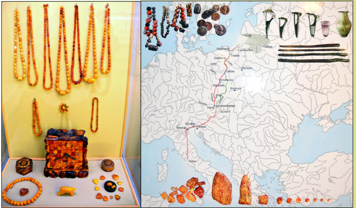
Meripihkan käyttötapoja sekä meripihkan matka Euroopan hoveihin.

Liettuan rannikolla Palangan lomakaupungissa ryhmämme oli määrä olla iltapäivällä. Meitä odotettiin hotellissamme, joka itse asiassa on metsäammattilaisten oma lomahotelli keskustan liepeillä. Neuvostoajan perintönä valtion metsäammattilaisilla on lisäksi virkistytymiskeskus hotelleineen Palangan Kretingassa aivan meren rannalla.