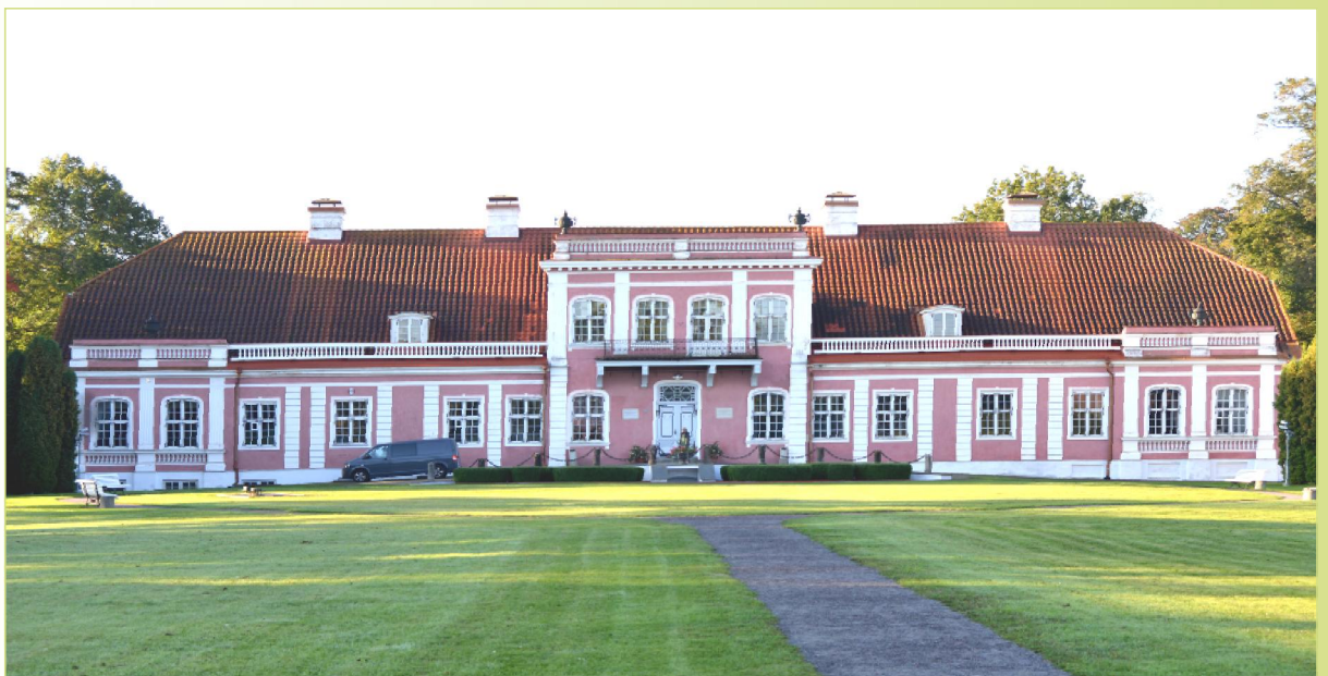
Sagadin kartanon päärakennus.