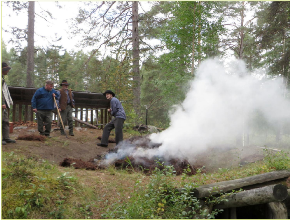
Tervanpolttoa Skogens dag -päivänä.