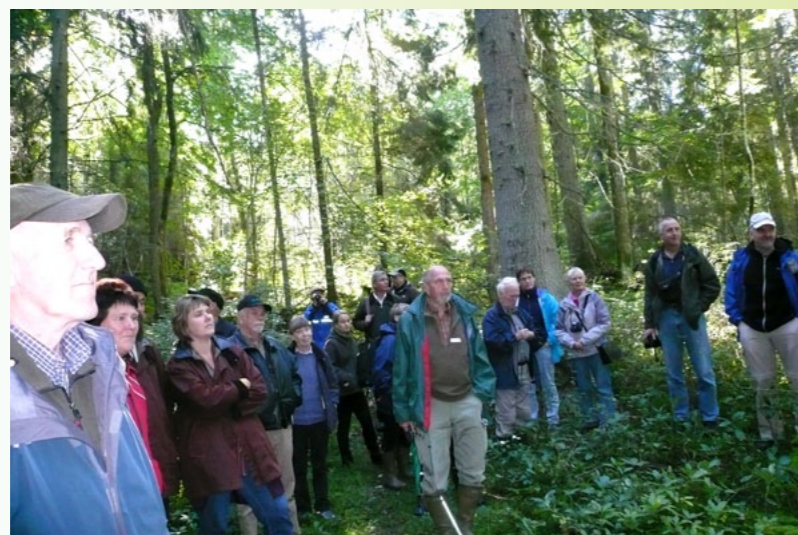
Pohjoismaista metsähistoriaväkeä Ombergin ekoparkissa.