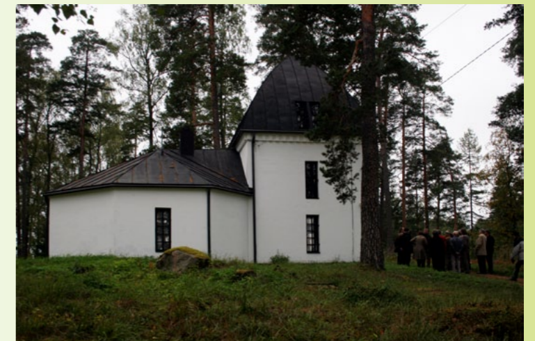
Tässä rakennuksessa oli Santamäen kartanon vesivasto.