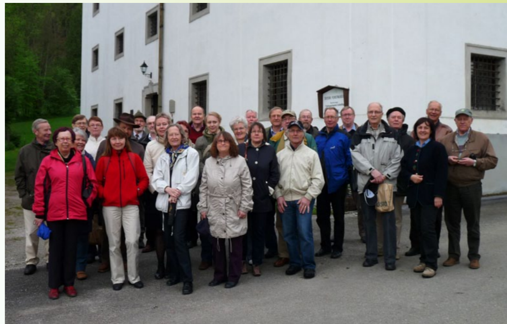
Ryhmäkuva Itävallan metsämuseon edessä.

Seuramme viime toukokuinen ulkomaan opintomatka suuntautui läntiseen Itävaltaan ja yhdeksi vuorokaudeksi myös Unkarin Soproniin. Perillä tiistai-iltapäivästä 4.5. perjantai-iltaan 7.5. kestäneellä matkalla kiersimme reittiä Wien–Sopron–Lackenbach–Grossreifling–Mariazell–Wien. Osallistujia oli 29.