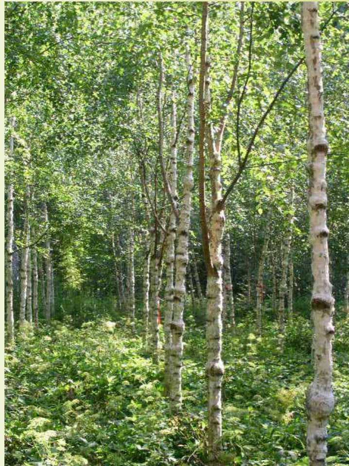
Metsäntutkimuslaitoksen nuorta visakoivikkoa. Kuva Eero Knaapi 2011.