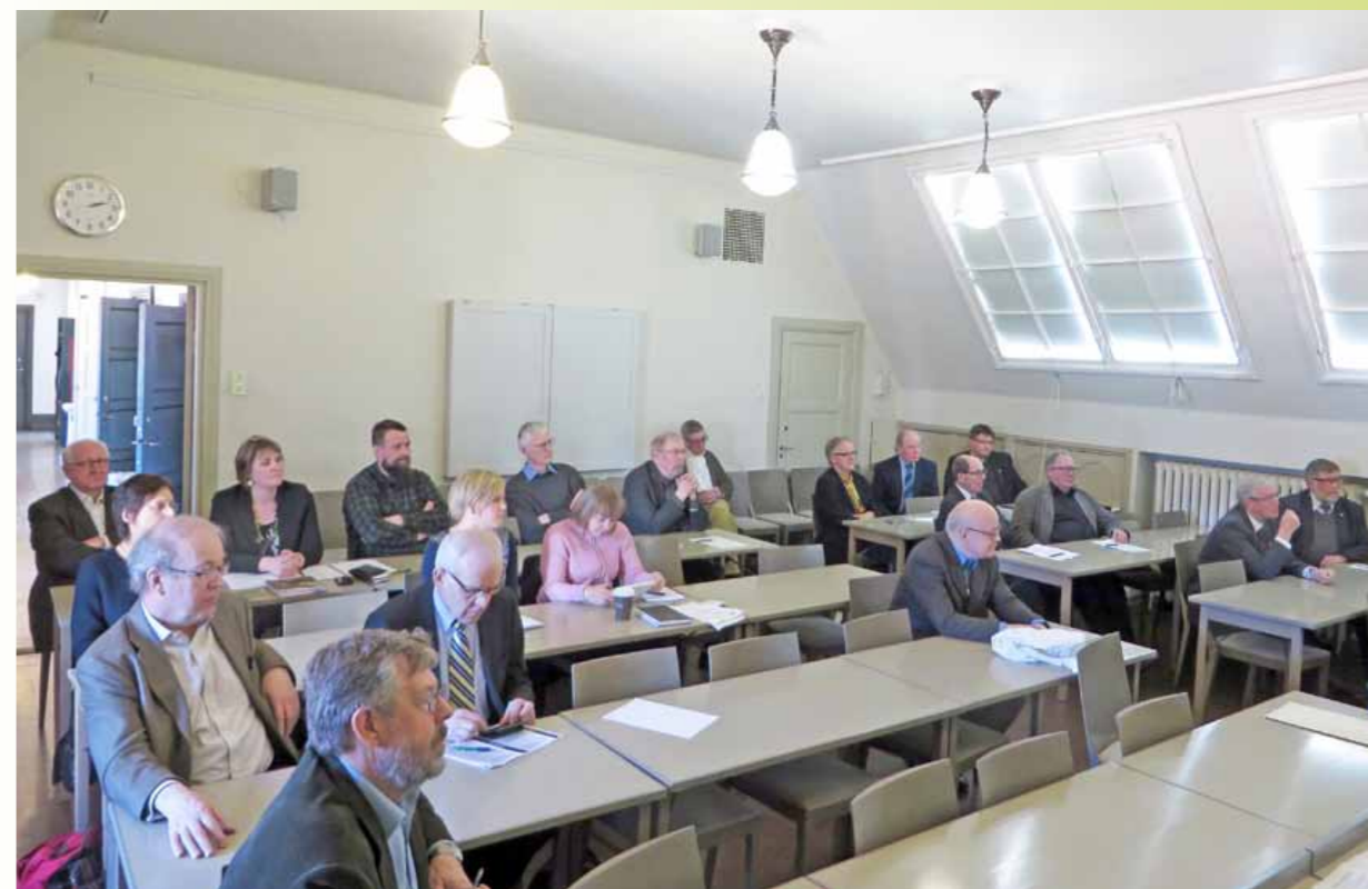
Metsähistorian Seuran vuosikokous 9.4.2014.