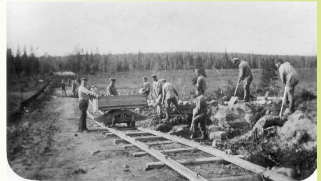
Kronstadtilaiset pakolaiset rakentamassa Kuhan - Simojärven maantietä. Metsähallituksen Ranuan hoitoalue 1920.

Metsähallitus harjoitti 1900-luvun alussa Ranualla ainoastaan puun pystymyyntiä. Oma hankintatoiminta alkoi hakkuukaudella 1925–1926, ja lyhyessä ajassa Metsähallituksesta muodostui ainut valtion metsiä hakkaava taho. Metsähallituksen hankintahakkuuta perusteltiin sillä, että ne tukisivat myös paikallisten toimeentuloa. Ranualla syntyi kuitenkin tilanne, jossa metsäpalkkoja määritti vain Metsähallitus. Huolimatta Metsähallituksen monopoliasemasta tilanne oli kuitenkin parempi verrattuna 1910-lukuun, jolloin metsäyhtiöt saattoivat siirtää hakkuutaan tulevaisuuteen odottamaan parempia aikoja. Metsähallituksen tuoma ansio saattoi olla kapea, mutta