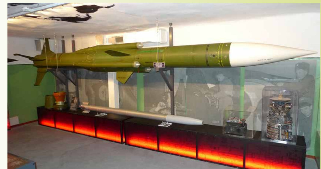
Plokstinen kylmän sodan museon rakettkokoelmaa.