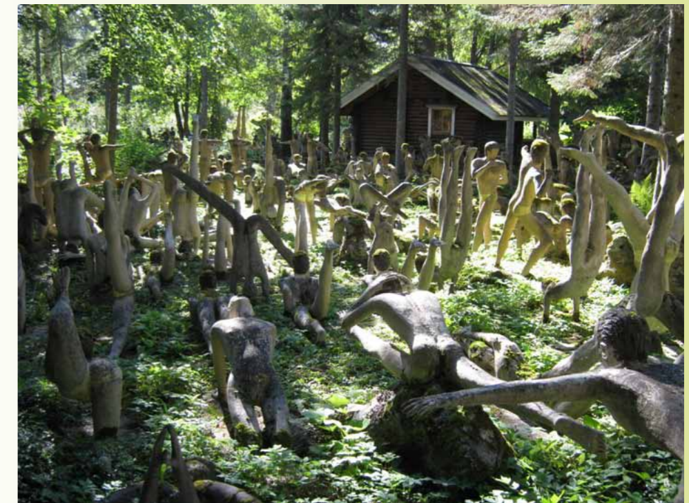
Veijo Rönkkösen betonipatsaat sammaloituvat puutarhassa.