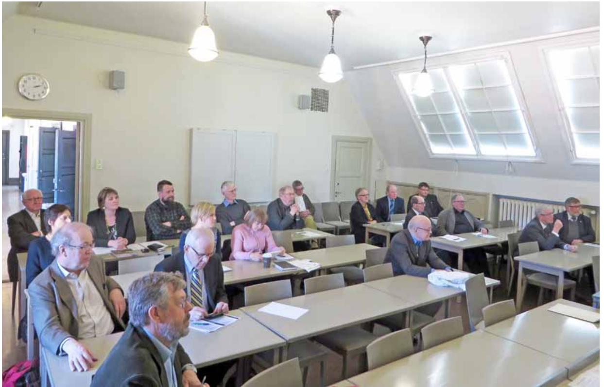
Metsähistorian Seuran vuosikokous 9.4.2014. Kuva Tapani Tasanen.