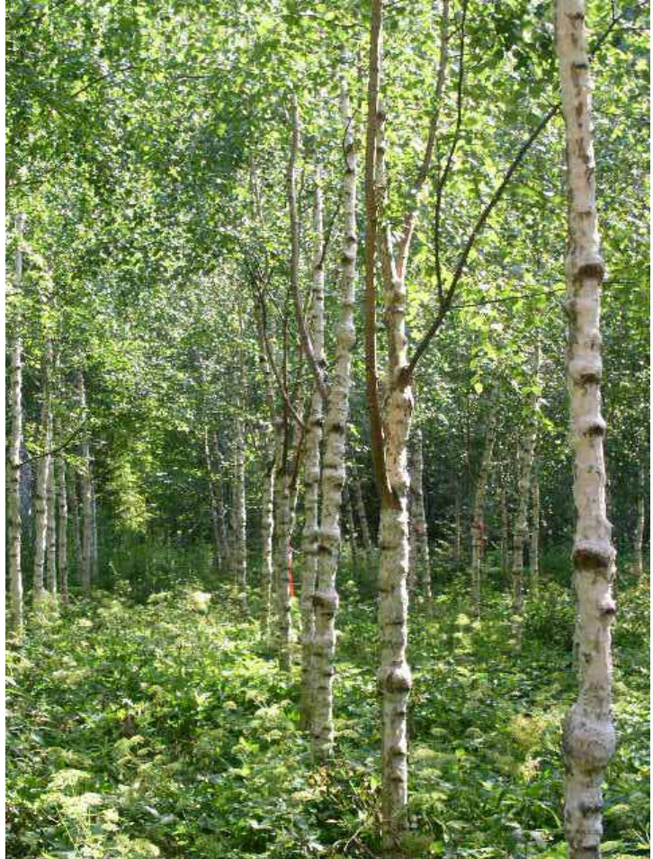
Metsäntutkimuslaitoksen nuorta visakoivikkoa.