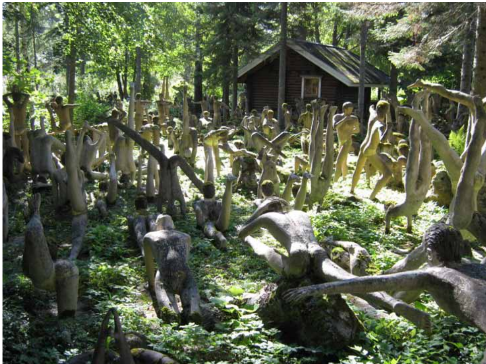
Veijo Rönkkösen betonipatsaat sammaloituvat puutarhassa. Kuva Eero Knaapi 2013.

n. 22:30 Siirtyminen bussilla majoitukseen Kruunupuiston Urholaan