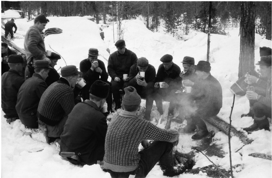
Haarainvaaran hakkuutyömaa Rovaniemen maalaiskunnassa helmikuussa 1964. Hirvaan metsätyökoulun I kurssi 1963-64 kahvitulilla palstalla.

Seuran yhteystiedot: Metsähistorian Seura, c/o Lusto, 58450 Punkaharju, puh. (015) 345 100, sähköposti: metsahistorian.seura@lusto.fi. Seuran kotisivun osoite saattaa muuttua vuoden 2013 aikana, mistä tiedotetaan jäsenille ja sidosryhmille.