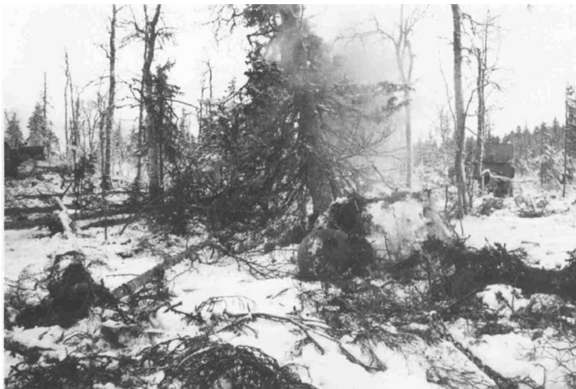
Hakkuualueen raivaus laahaussinkkimenetelmällä käynnissä. Suuri kuusi kaatumassa. Metsähallituksen Pohjois-Taivalkosken hoitoalue 2.11.1955.