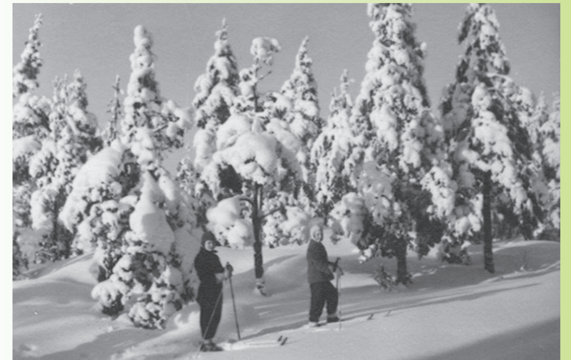
Kuvat s. 2-3: Lusto, Suomen Metsäyhdistyksen kokoelma.

Tarjoilujen järjestämiseksi vuosikokoukseen, esitelmätilaisuuteen sekä jäsen- ja tutkijatapaamiseen pyydetään ilmoittautumaan 18.3.2011 mennessä sähköpostilla leena.paaskoski(at)lusto.fi tai postitse osoitteeseen Metsähistorian Seura, c/o Lusto, 58450 Punkaharju.