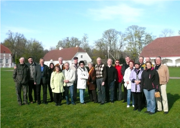
Matkalaiset Sagadin kartanomiljöössä.

Toukokuun 7.–10. päivinä järjestetyn seuramme opintomatkan pääaiheena oli Saarenmaan metsä- ja kulttuurihistoria. Lisäksi kävimme Sagadin kartanossa ja Viron Metsämuseossa. Matkalle osallistui 20 henkeä.