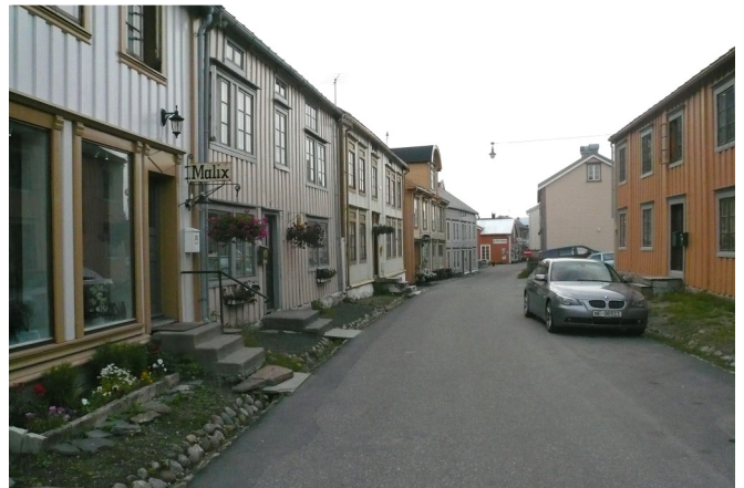
Mosjøenin vanhoja puutaloja.

Toisena retkeilypäivänä ajettiin Vefsn-vuonoa seuraten rannikkoseuduille Alstahaugiin. Siellä tutustumiskohteena oli taimitarha ja sen vierellä oleva puulajipuisto sekä lähituntumassa sijaitseva moderni Petter Dass -museo.