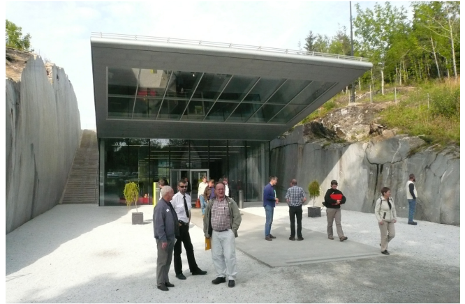
Petter Dass -museon modernia arkkitehtuuria.

Hattfjeldalissa tutustuttiin seudun suurimman yrityksen, Arbor-lastulevytehtaan, yli 50-vuotiseen historiaan ja nykypäivään. Firman nimi on monelle tuttu, onhan Lustossa esillä Suomen ensimmäinen puunkaato kone "Arbor". Kävimme myös Sijti Jarne -nimisessä saamelaisen kulttuurin keskuksessa. Matkalla ensin länteen ja sitten pohjoiseen kohti Mosjøeniä kävimme myös metsässä tutustumassa luonnonmukaiseen metsänkäsitteeseen, poikkesimme Granen talomuseossa ja Laksforsenin turistikahvilassa. Illalla katseltiin Mosjøenin vanhaa puutaloaluetta, joka on onnistuttu säästämään markettien rakentamiselta ja jossa uudetkin pientalot tehdään vanhaan tyyliin, ja käytiin museotalossa.