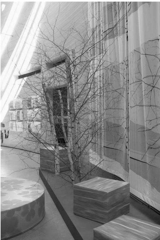
Metsä ja tekstiilit kohtaavat uudessa Kankaalla -näyttelyssä.

Metsä ja tekstiilit kohtaavat yllättävissäkin paikoissa kuten metsäteiden pohjustuskankaissa, paperikoneen viiroissa, puiden taimisuojojissa tai kumisaappaiden tukikankaissa. Käytetyistä paperitehtaiden suodatinkankaista, ”tehtaan viltistä”, tehdastyöläisten perheet ompelivat talvivaatteita.