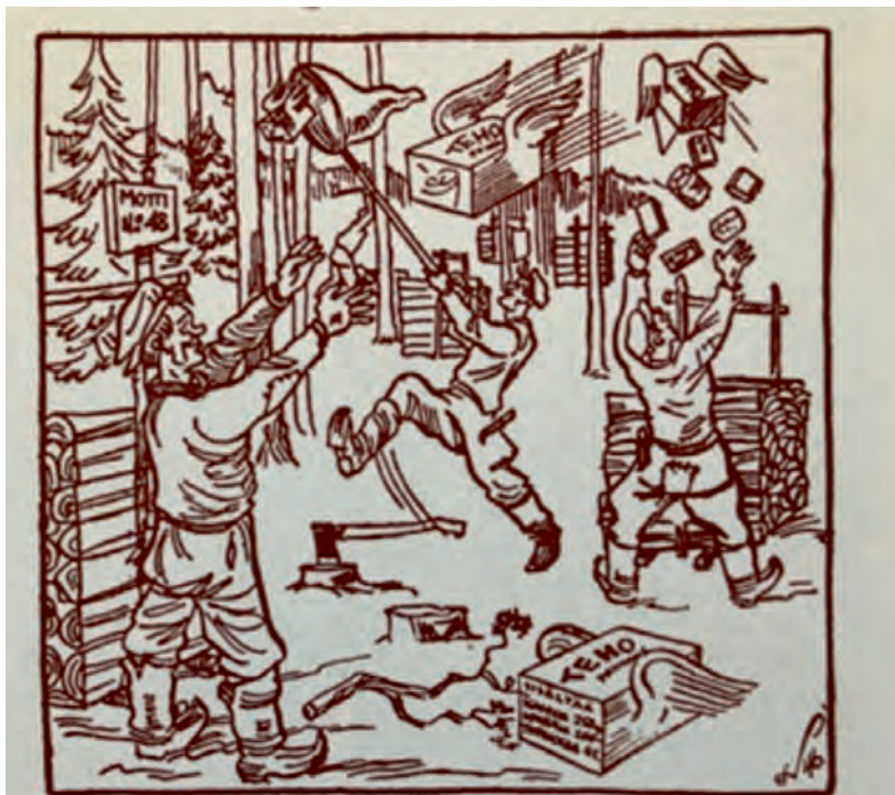
ovat ilmestyneet taas ahkerien metsätyömiesten hakkuupalstoilla. Niiden tavoittelu parantaa hakkuutuloksia ja työansioita. Pannaanpahan nyt lopultakin metsätyöt käyntiin täydellä höyryllä tupakan, sokerin ja kahvin kannustamana.

Sodasta väsyneiden työmiesten työnnon lisäämiseksi vuosina 1945-46 Metsätyömaiden muonitustoimistolla oli käytössä Tehopakkaus, joka sisälsi kahvia, sokeria ja tupakkaa. Tehopakkauksen osto-oikeuden sai tekeillä 48 pinokuutiometriä halkoja kahdessa viikossa tai tähän suhteutetun määrän muuta puutavaraa. Jos tulos nousi 72 pinokuutiometriin, niin silloin sai osto-oikeuden kahteen Tehopakkaukseen.