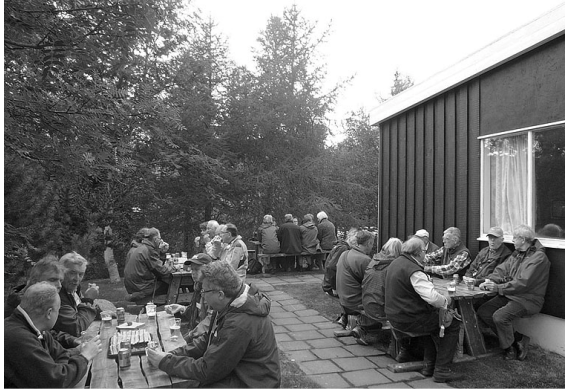
Elokuussa 2007 islantilaisella ulkoilmalounaalla.