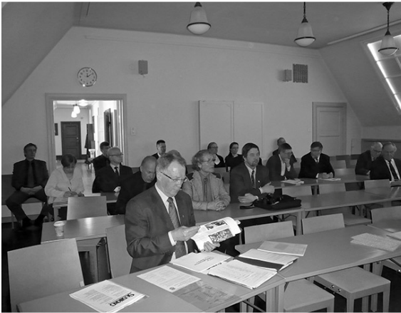
Vuosikokouksen 2007 osanottajia Tieteiden talolla Helsingissä.

paikassa A. K. Cajanderista kertova elokuvaesitys sekä metsähistorian tutkijataapaaminen, johon osallistui lähes 30 henkeä.