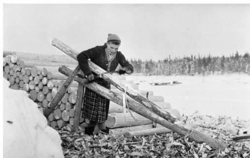
Parkkuutyötä Ristijärvellä Tervajärven lanssissa talvella 1956-57.

hoidossa ja ympäristösuunnittelussa – päättäjinä, näkijöinä ja tekijöinä. Näkökulmia naisen metsäsuhteeseen tarjoavat kansanperinne, myytit, folklore, kauneus, terveys ja luonnossa virkistäytyminen, media, taide ja tiede sekä arjen ja juhlan muut metsäiset ulottuvuudet.