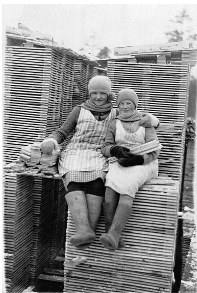
Tytöt "pinkalla" Torasjoen Sahalla Suojärvellä 1930.

Naisten osuutta metsään liittyvissä toimissa tuodaan esille historiallisena jatkumona. Mukana ovat metsän tuotteiden keräily, kaskeaminen ja metsälaidunnus, lämmitys, polttopuu-huolto, kriisiajat, työ metsässä ja uitolla, tehdastyö sekä muut työtehtävät, joihin naiset ovat osallistuneet.