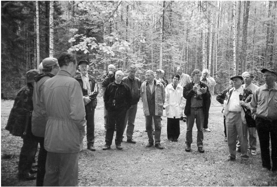
Opintoretken osanottajia Viron Maatalouskorkeakoulun Järveljan havaintometsässä.