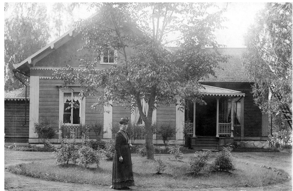
Evon metsäopiston johtajan asuintalo 1894. Keräyshankkeen hienoa satoa.

Kuvien lahjoittajat ovat valtaosin olleet metsäammattihenkilöitä tai heidän perikuntiaan, mutta pari lahjoitusta on saatu ulkopuolisiltakin. Lahjoitetuista kuvista vanhimmat ovat 1890-luvulta, mutta pääosin kuvat ovat 1900-luvun jälkipuoliskolta. Määrältään suppein lahjoitus on yksi kuva ja laajin 900 kuvaa. Kaikista kuvista on saatu ja tallennettu myös taustatiedot. Sellaisilla kuvilla, joista ei löydy taustatietoja, ei juuri ole käyttöarvoa.